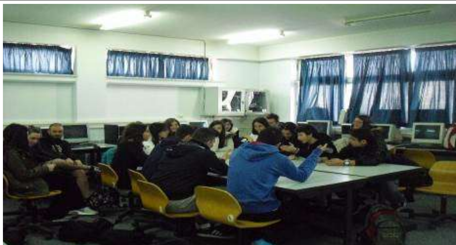
Εικόνα 2: Το «ενυδρείο» στο Εργαστήριο Πληροφορικής

Έπειτα, αναλαμβάνοντας τον ρόλο του συντονιστή της συζήτησης, έθεσα κατά σειρά τα ακόλουθα ερωτήματα στους μαθητές που είχαν ασχοληθεί με το 1 ο Φύλλο Εργασίας και είχαν μελετήσει το διασκευασμένο κείμενο του Γ. Μπασλή , κινητοποιώντας όσο το δυνατόν περισσότερους μαθητές, ώστε να συμμετέχουν στη συζήτηση: Ποια είναι η στάση σας απέναντι σε παραδοσιακές και μη μορφές οργάνωσης της τάξης και επικοινωνίας εκπαιδευτικού-μαθητών; Πώς αυτή η στάση διαμορφώθηκε από την εμπειρία σας; Ποια είναι τα πλεονεκτήματα και τα μειονεκτήματα της παραδοσιακής επικοινωνίας στην τάξη; Ποια είναι τα πλεονεκτήματα και τα μειονεκτήματα της εναλλακτικής επικοινωνίας στην τάξη; Ποια είναι η βασική προϋπόθεση του συνεργατικού διαλόγου;